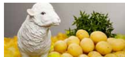
L'agneau, trait commun entre Pessah et Pâques