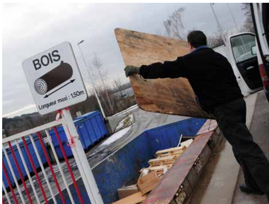
Le bon tri passe souvent par la déchetterie !