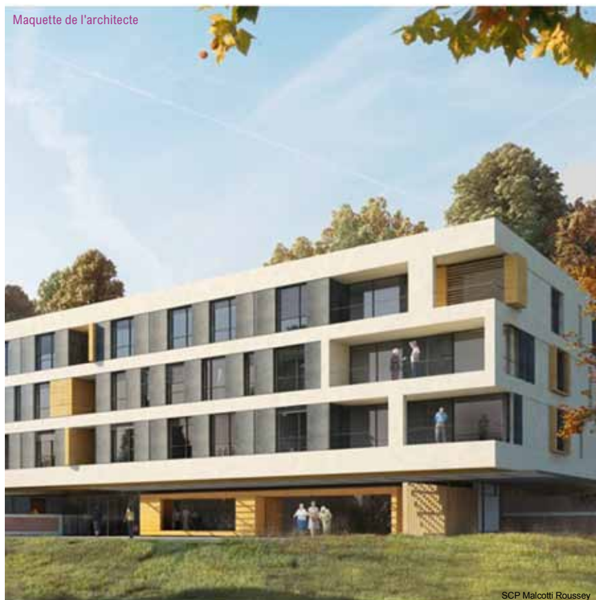
SCP Malcotti Roussey