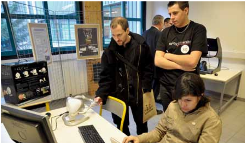
La découverte de l'IUT est le prélude à d'autres portes ouvertes