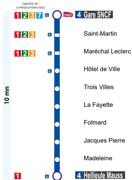
Schéma de ligne

Le respect des horaires est fonction des conditions de circulation