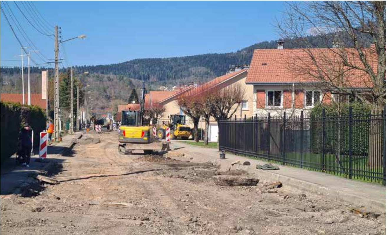
Les travaux devraient être achevés dans moins d'un an.