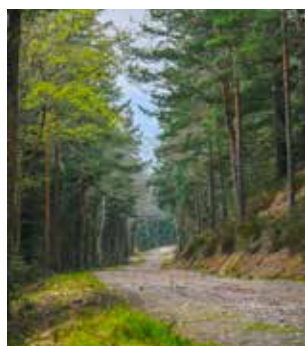
L'accès à la roche Saint-Martin méritait d'être repris !

Offrant un point de vue remarquable sur Saint-Dié-des-Vosges, la roche Saint-Martin était devenue difficilement accessible en raison d'un chemin fortement dégradé par la pluie et les violents orages. Fin avril, il a été remis en état par l'entreprise Colas qui s'est chargée de balayer la chaussée existante, poser un nouveau revêtement, poser des bois d'eau pour per-