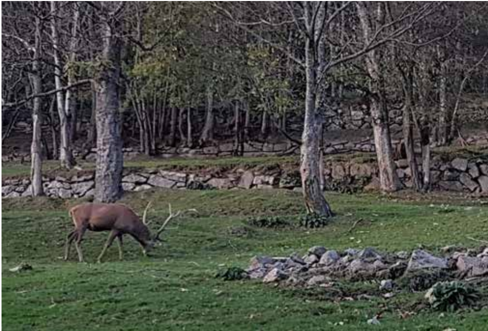
La forêt se partage.