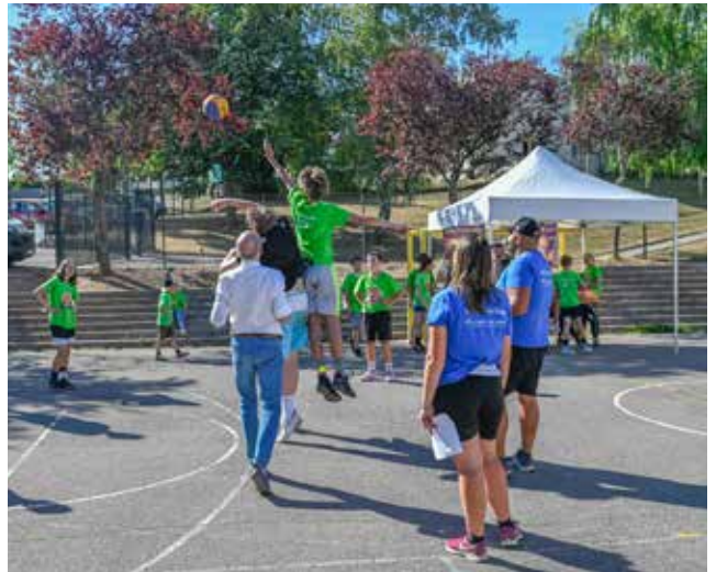
La politique de la Ville, Pilier de la cohésion sociale

D epuis 1989, la Ville de Saint-Dié-des-Vosges est partenaire des dispositifs de la Politique de la Ville qui vise, à travers divers contrats, à lutter contre toutes les formes d'inégalité. Dans ce cadre, depuis 2015, la municipalité s'est engagée dans un contrat à échelle intercommunale de sept ans (prolongé d'un an grâce à la loi Finances suite à la crise sanitaire) pour redéfinir la géographie prioritaire sous le prisme de différents piliers : la cohésion sociale, le cadre de vie et du renouvellement urbain mais aussi l'emploi et le développement économique. Des thématiques transversales telles que la jeunesse, la lutte contre les discriminations ou l'égalité homme / femme viennent renforcer le contrat au même titre que la