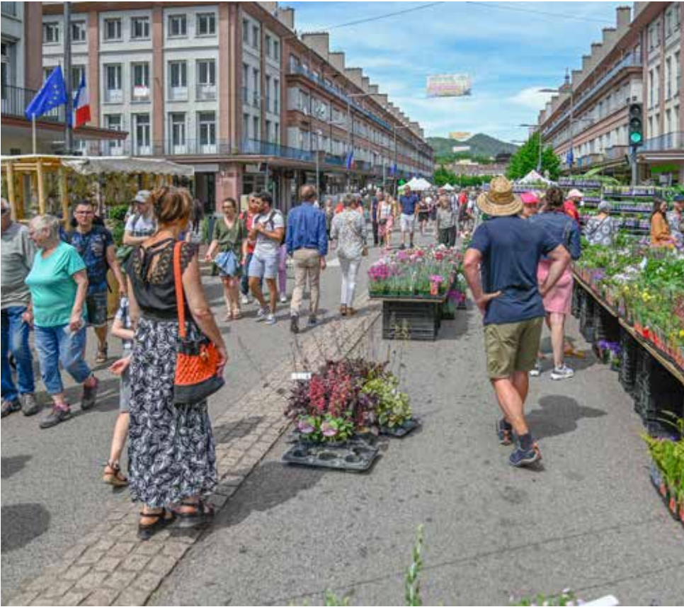
Un jardin dans ma ville se déroulera les 20 et 21 mai.