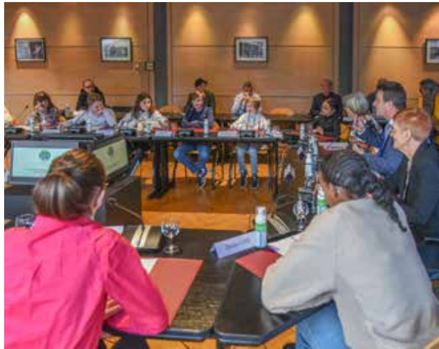
Un temps d'échange constructif.

M ieux connaître le fonctionnement de l'institution, pouvoir échanger avec leurs homologues adultes mais aussi mieux les impliquer dans la vie de la cité : les objectifs de la première rencontre entre le conseil municipal des jeunes et le conseil municipal des adultes étaient multiples, ce mercredi du mois de mars. Multiples et parfaitement atteints ! Durant plus d'une heure et après avoir tracé un court bilan de leurs actions 2022, les jeunes âgés de 10 à 17 ans ont posé mille et une questions au maire Bruno Toussaint, qui n'a pas hésité à tendre le micro à ses adjoints sur des questions très spécifiques. De l'origine de son engagement politique à