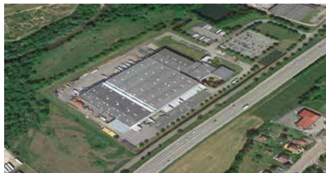
Lucart Group a racheté l'ancienne base Intermarché

L ibérée par son ancien propriétaire Intermarché, la base logistique créée en 1993 dans la zone d'Hellieule a déjà retrouvé un repreneur ! Situés à proximité de la N59 et non loin d'axes routiers