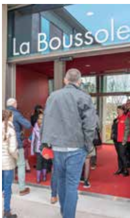
La Boussole est ouverte