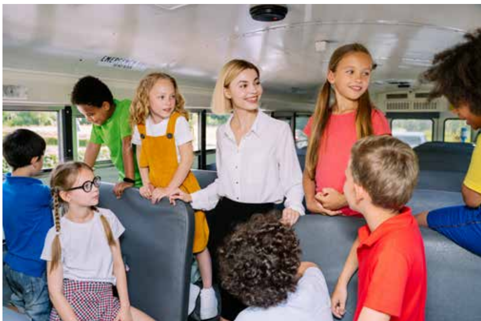
Le coût de la formation BAFA est prise en charge par la Ville.

Tél. : 03 29 42 22 22 www.vosges-porte-alsace.fr