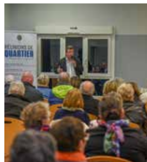
Succès total à La Bolle / Les Tiges

fibres, nettoyage des fossés, nuisances sonores et pollution visuelle, circulation, pistes cyclables, sécurité des piétons... Aucun sujet n'a été botté en touche et des rendez-vous « terrain » ont été pris dans la foulée pour mieux apprécier les demandes. Et pour l'avenue du Cimetière-Militaire, il va falloir attendre encore peu... Elle passera en zone 30 bien avant qu'un tapis tout neuf ne soit déposé ! ●