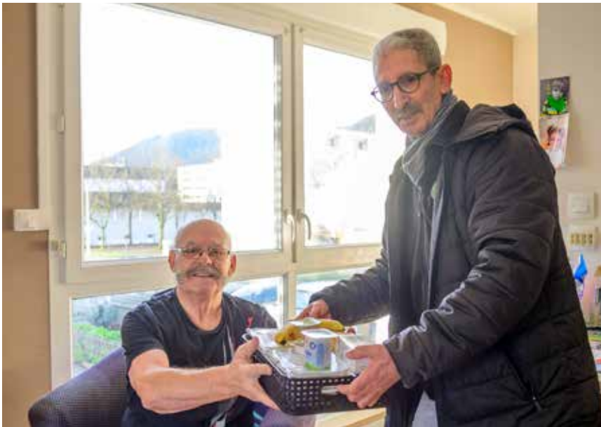
Le service de portage des repas fait l'unanimité