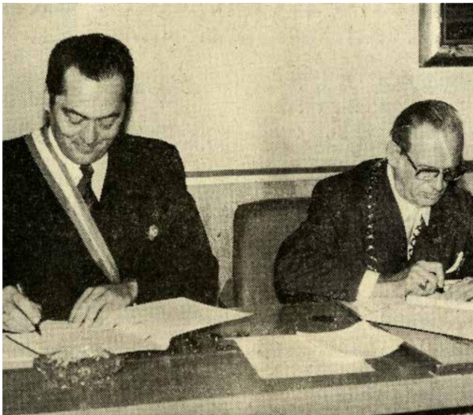
Le jumelage a été signé le 20 octobre 1973 à Friedrichshafen

Le Ballet des Saisons est ouvert tous les jours de 8 h à 12 h 30 et de 14 h à 19 h. Et fermé les lundis et les mercredis matin. ●