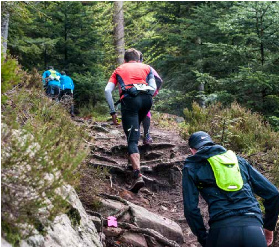
Le premier Trail des Collectivités s'appuie sur le légendaire Trail des Roches